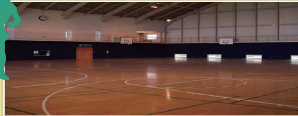
専用体育館 ●(36m×29.5m) ●バレーボール2面●バスケットボール2面●バドミントン8面 ※徒歩10分