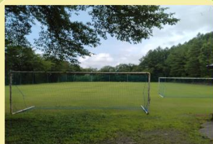
三本松グラウンド ●(112m×71m)