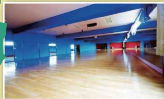
専用スタジオ ●(30m×9.7m)●ダンス